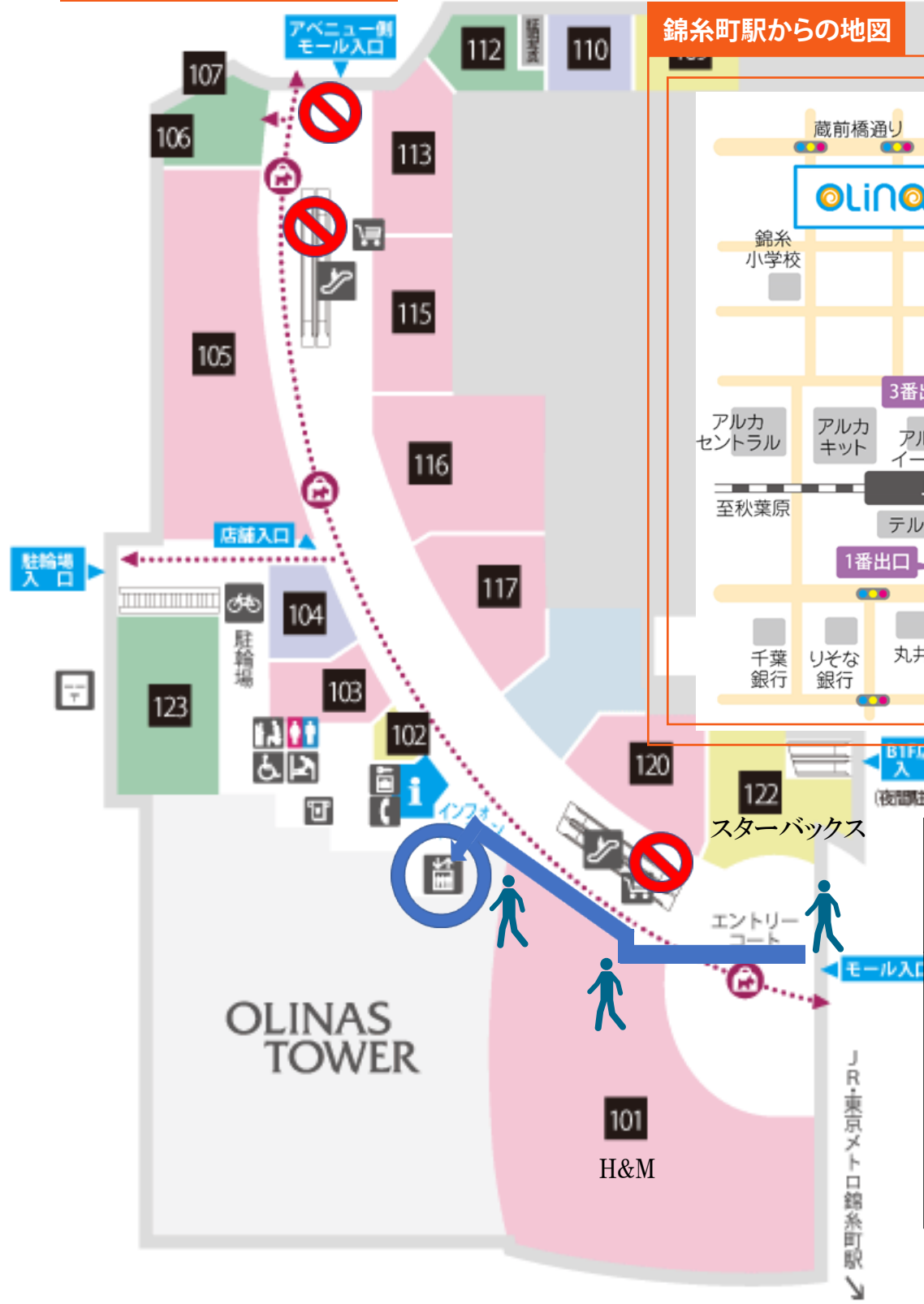
錦糸町駅からの地図